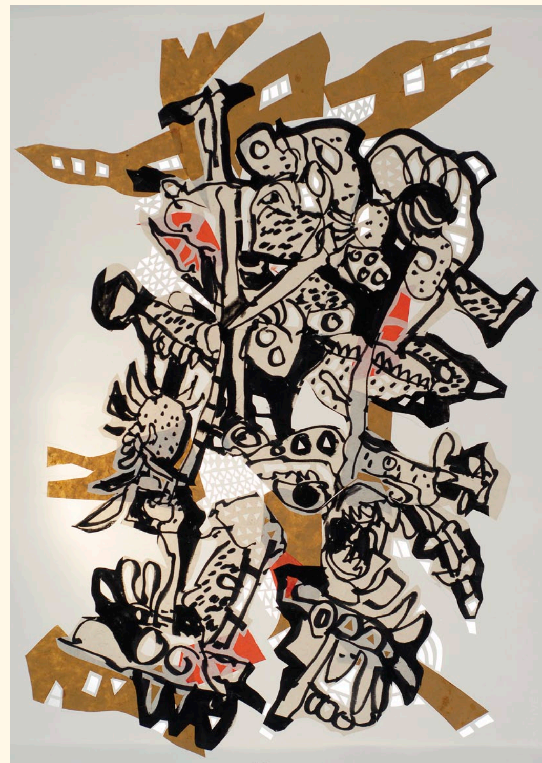
Œuvre réalisée à l'atelier de Chantale Harvey, 2005, papier collé, papier troué, 120 × 80 cm.