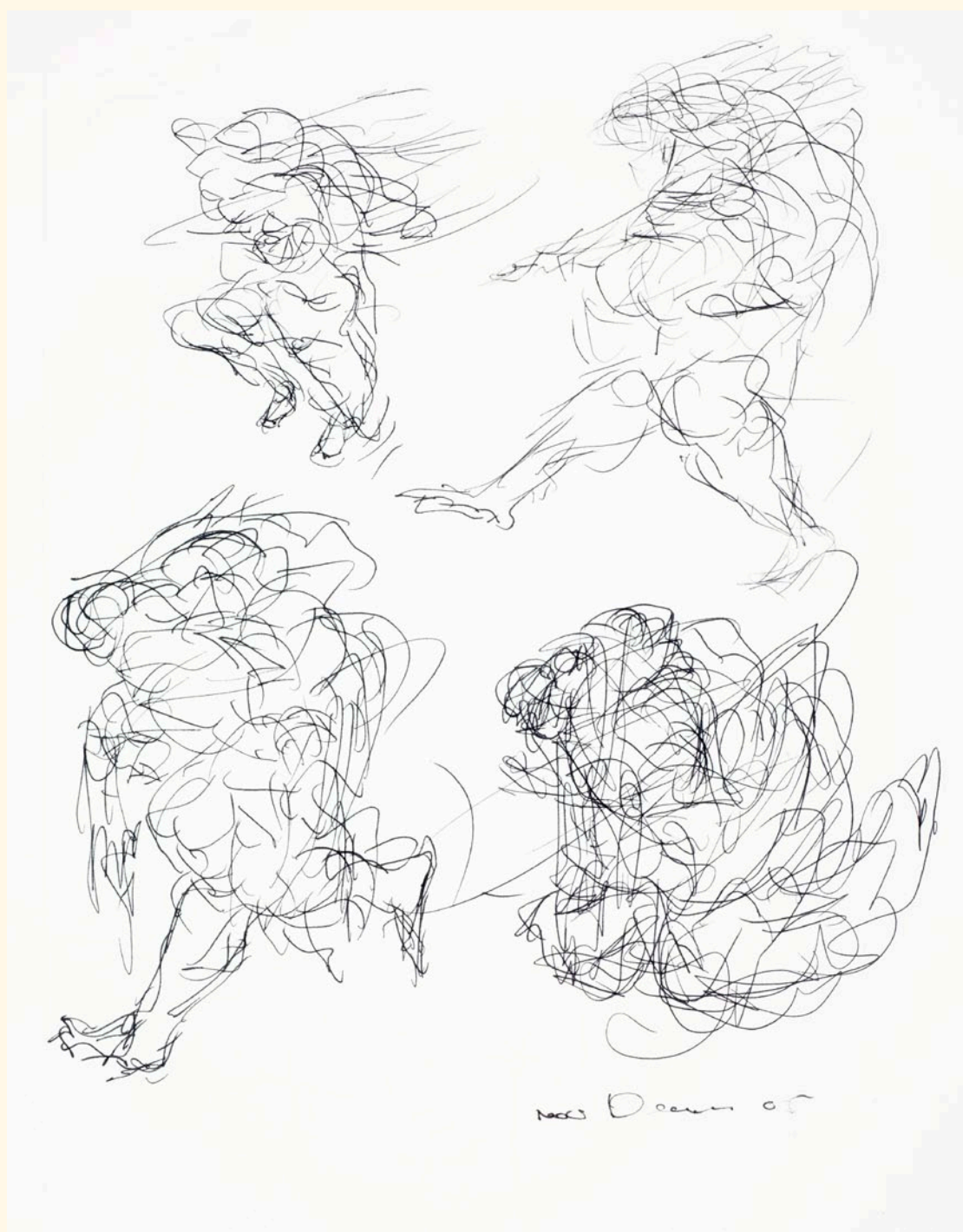
Dessin, 2005, encre.