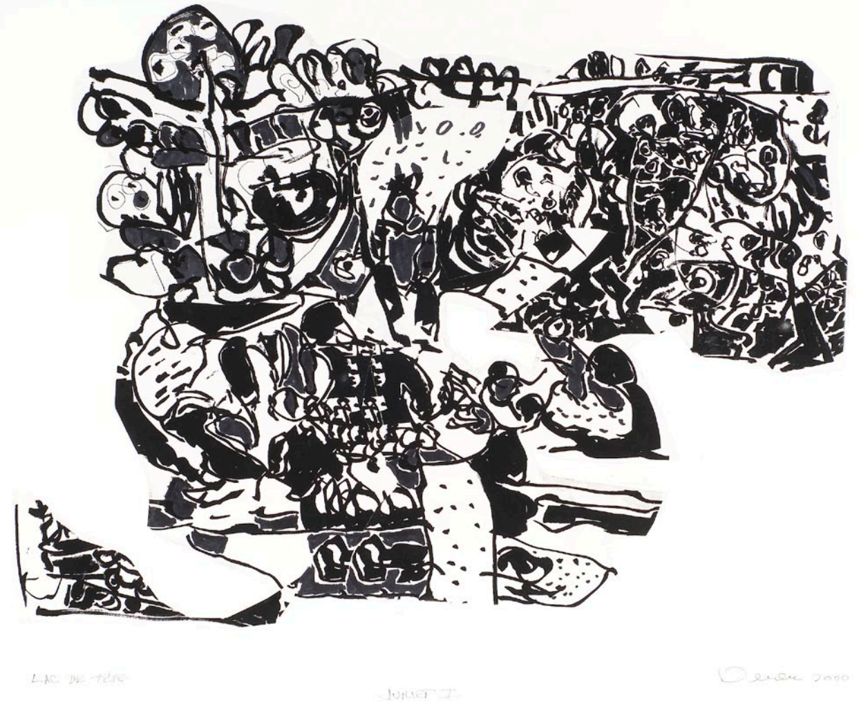
Lac Labelle, série des Lacs, 2001, dessin collage, 45 × 59 cm.