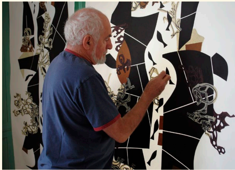
Réalisation de Chapelle/ Capilla à la Villa James, Percé, 2008.